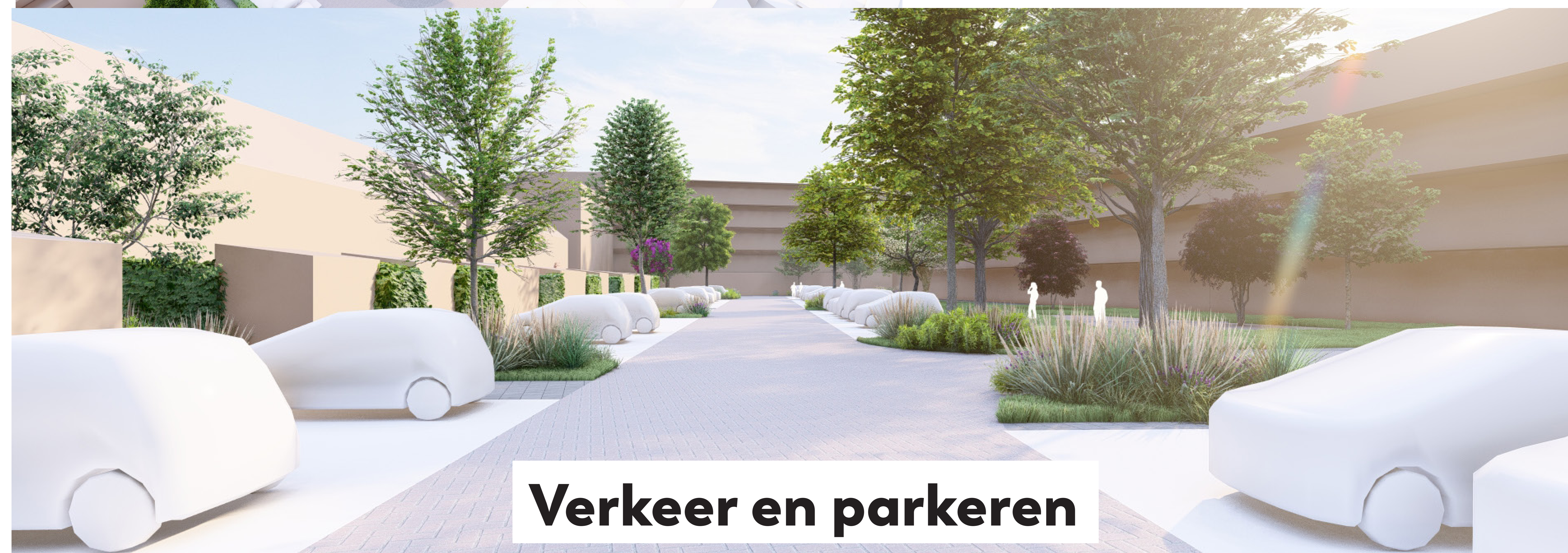
Verkeer en parkeren