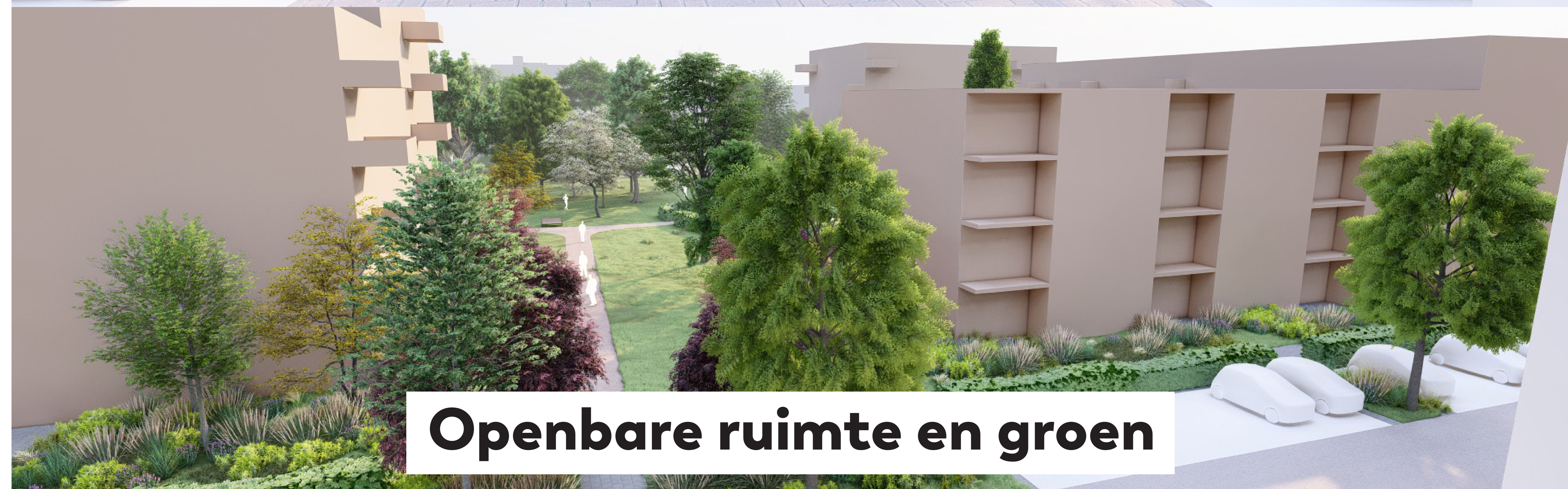
Openbare ruimte en groen